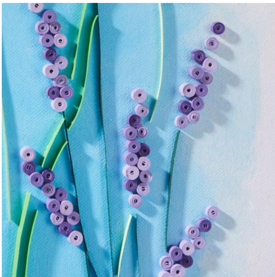
Łubin z pasków do quillingu