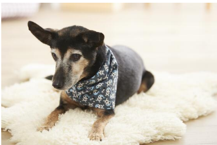
Szalik dla psa

Szukasz więcej instrukcji szycia dla swoich zwierząt? Co powiesz na przykład na szalik dla psa lub zabawkowe myszy dla kota. Obie instrukcje szycia są bardzo łatwe do wykonania i nadają się również dla początkujących.